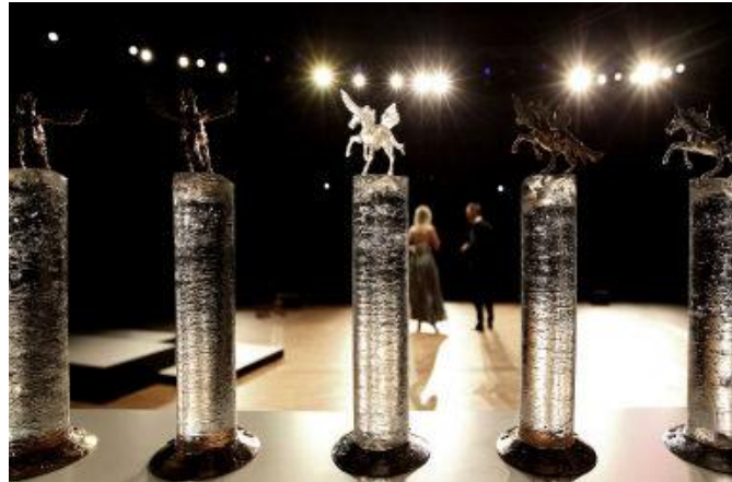
Die begehrten Pegasus-Trophäen des OÖN-Wirtschaftspreises